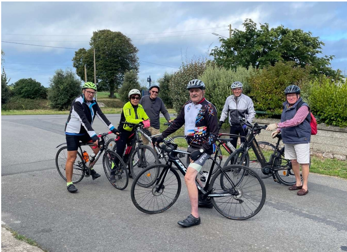
Fête du vélo le 24 septembre 2023

Si les conditions atmosphériques sont défavorables en saison hivernale, à la place d'une sortie en vélo route Sortie VTT départ place de la Poste à 9h30